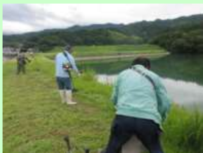
ため池周辺の管理

また、集落の寄合などで住民が集まる集会所周辺の農地や水路、農道付近に景観形成活動として植栽したプランターを設置しています。近年の高温や少雨などの異常気象で、景観形成作物の栽培管理が難しくなっていますが、絶やさぬよう努力しています。