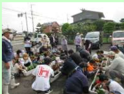
植栽による景観形成活動