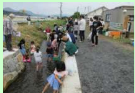
管理用水で生き物調査